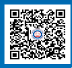
Đăng ký xét tuyển online

Trụ sở chính: 235 Hoàng Sa, phường Tân Định, TP.HCM