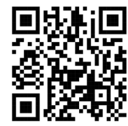
Google Map Trụ sở chính