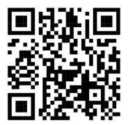
Google Map Cơ sở 2